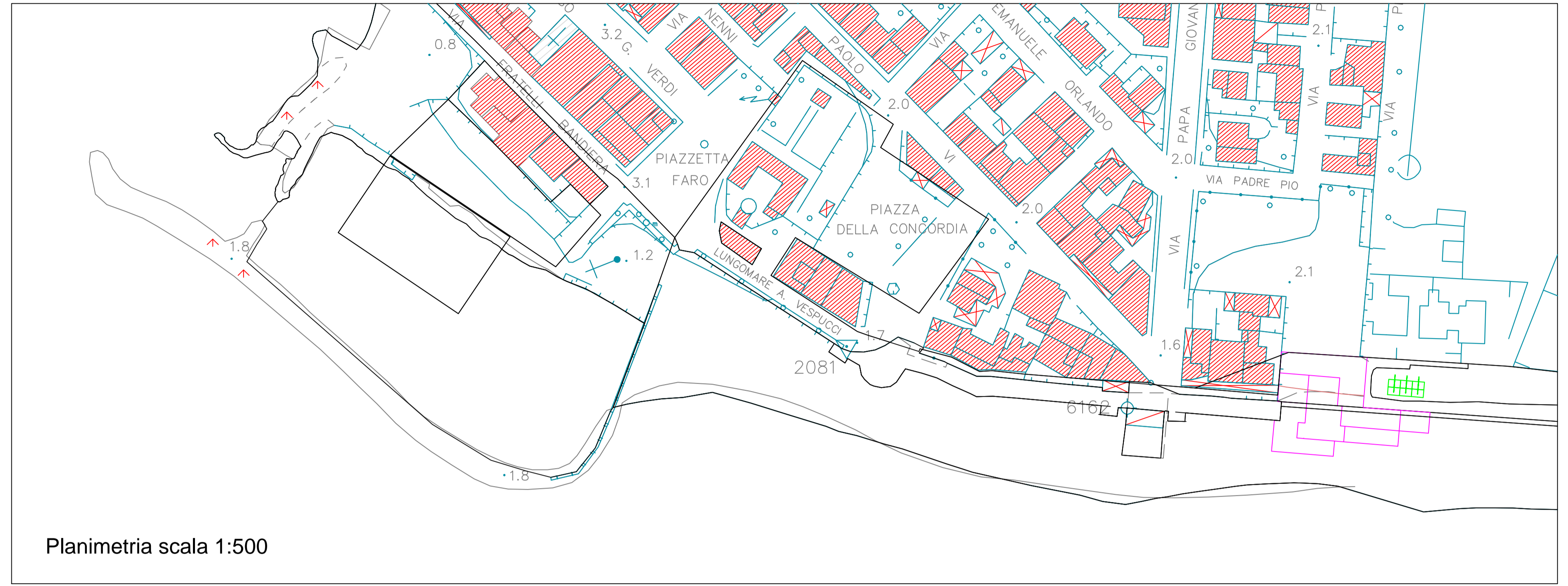
Planimetria scala 1:500