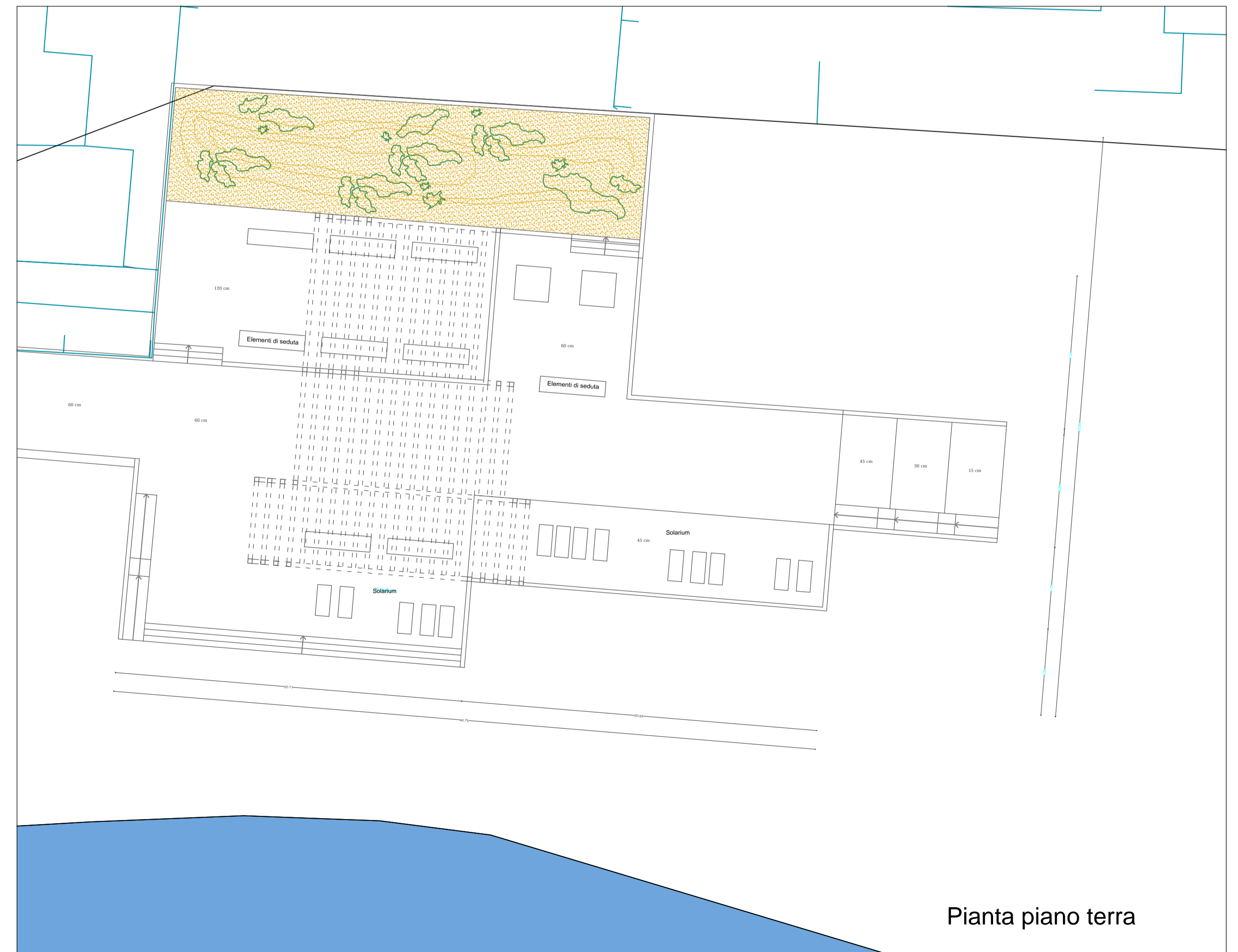
Pianta piano terra