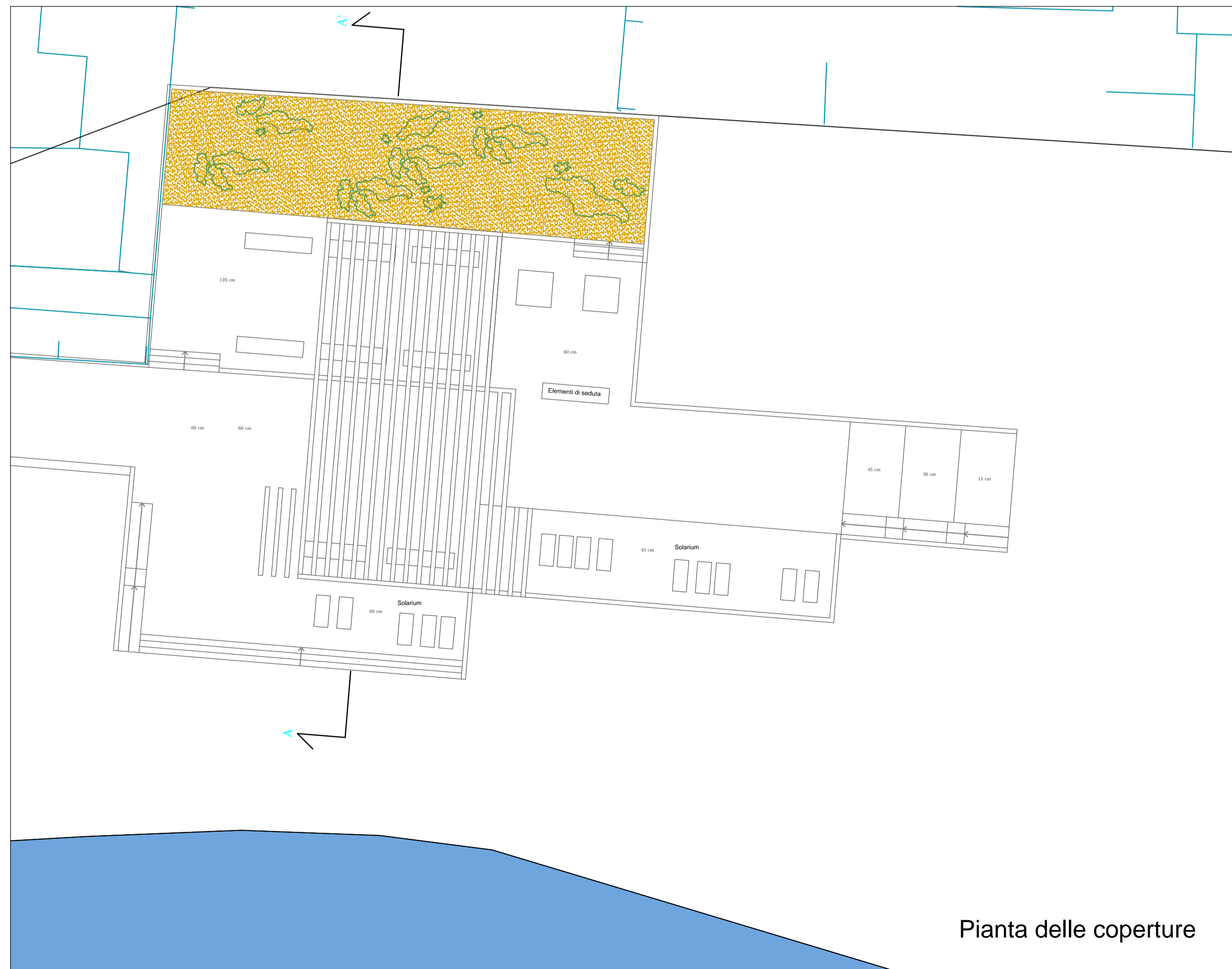
Pianta delle coperture